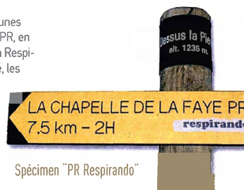
Spécimen "PR Respirando"